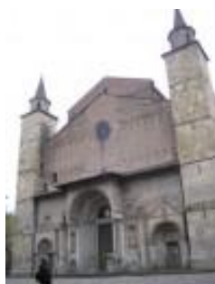
Fidenza San Donnino