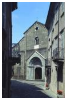
Berceto il Duomo