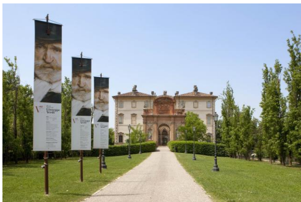
Busseto Villa Pallavicino