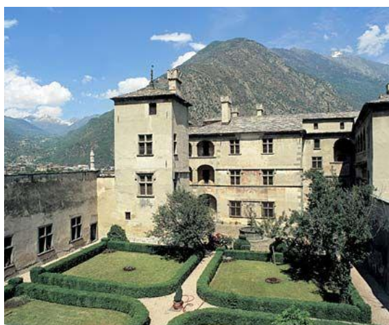
Castello d' Issogne