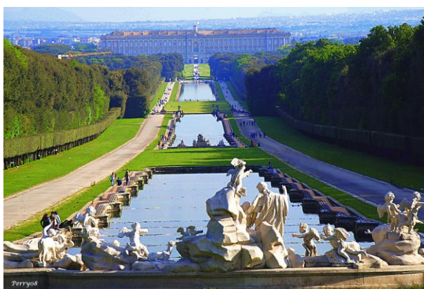
Reggia di Caserta