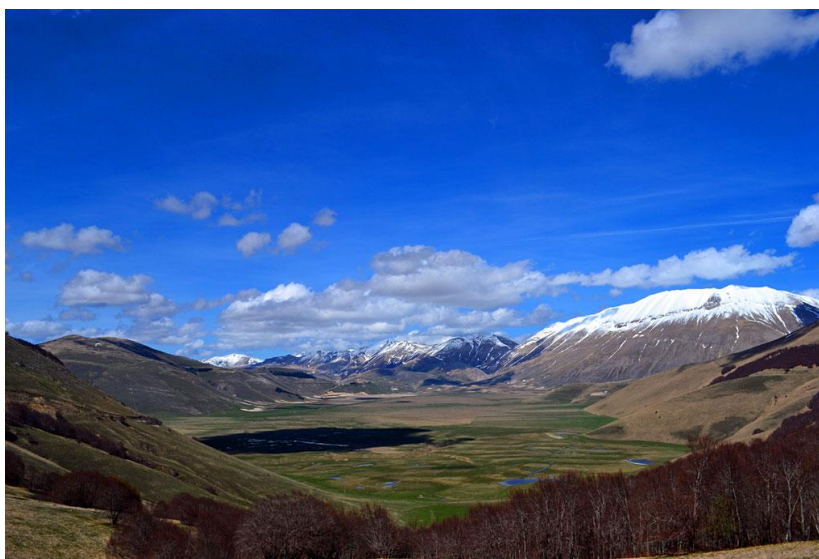
Pian Grande e monte Vettore