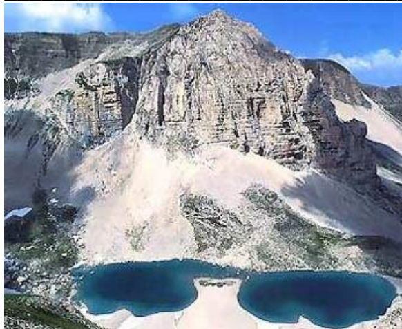
Lago di Pilato e Pizzo del Diavolo