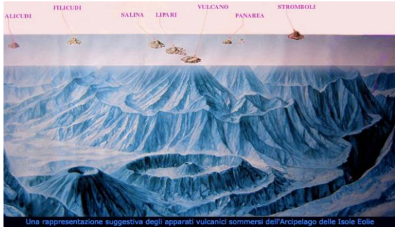
Una rappresentazione suggestiva degli apparati vulcanici sommersi dell'Arcipelago delle Isole Eolie