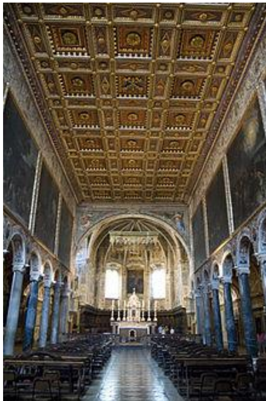
Chiesa di San Pietro