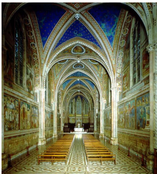
Basilica di San Francesco