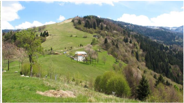
Col dei Prai

Qui prendiamo a sinistra il sentiero Cai 10 che sale su mulattiera lastricata detta "Le Scalette" che porta alla casa Costa. Lungo la salita si può fare una breve deviazione alla casa Coli mt. 690 dove un cartello porta a vedere delle tombe di età longobarda. Ritornati sulla mulattiera segnava 10 proseguiamo la salita raggiungendo il col Lavar e le case Costa mt. 915. Lasciate le case Costa e attraversata la strada il sentiero sale la dorsale erbosa di Col Lavar, un bel punto panoramico, fino a immettersi sulla strada comunale del Col dei Prai in località La Ritonda che seguiamo passando per case Rizzoni mt. 1185. Passiamo il Col dei Prai raggiungiamo un bivio (diritti verso malga Fiabernù e Forcelletto) quotato mt. 1289 dove deviamo a destra scendendo lungo una strada che porta prima alla casera Col dei Britti mt. 1230 e poi a casera Bobo mt. 1175 dove incrociamo il sentiero Cai 13 proveniente dal Forcelletto. Proseguiamo la discesa sul sentiero 13 attraversando i pascoli sotto casera Col dell'Innocente mt. 1135 raggiungendo case Vanin mt. 1072. Proseguiamo la discesa in val Lavello fino alla località Fagher mt. 651 dove incrocia la mulattiera della Val goccia sentiero Cai 20 che sale a case Magnola e a località Finestron. Ora scendendo per la val Goccia ripassando per "I Capitelli" rifacciamo il percorso dell'andata ritornando a Cismon del Grappa. Bicchierata di fine escursione e rientro con il ns. pullman a Padova.