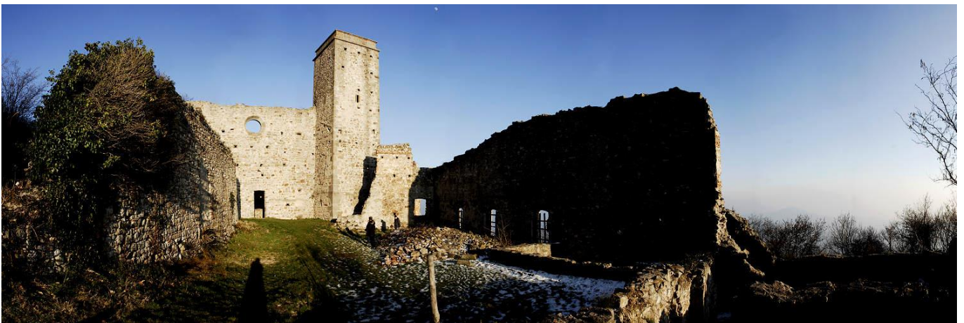
Monastero degli Olivetani