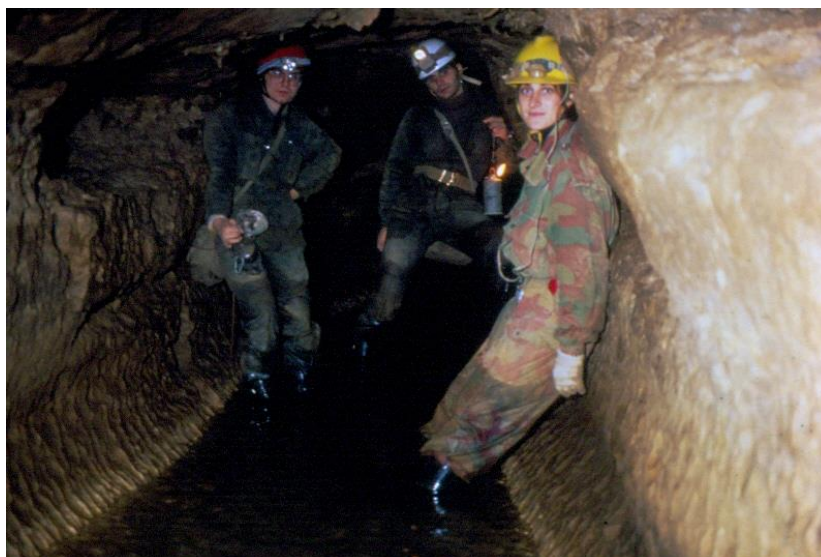
verso il Ramo delle Marmitte