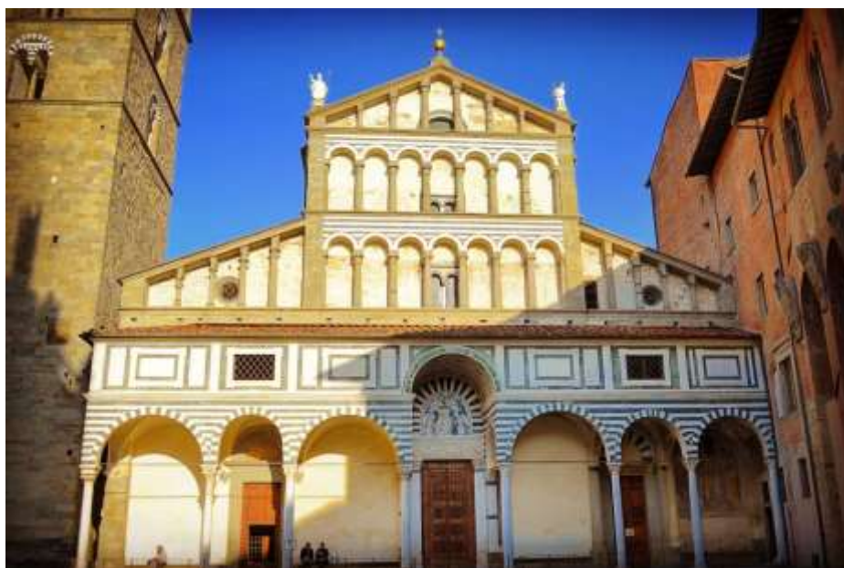
Cattedrale di Pistoia (San Zeno)