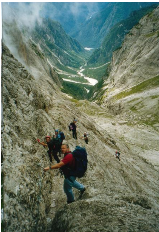
Ferrata Roghel discesa Cadin di Stallata