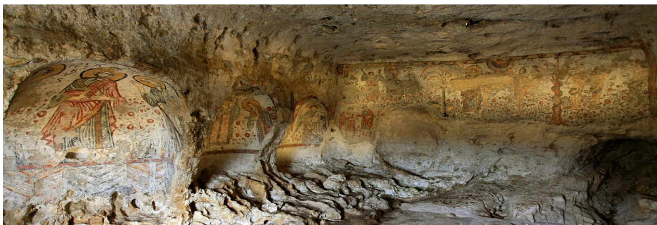
Cripta del Peccato Originale