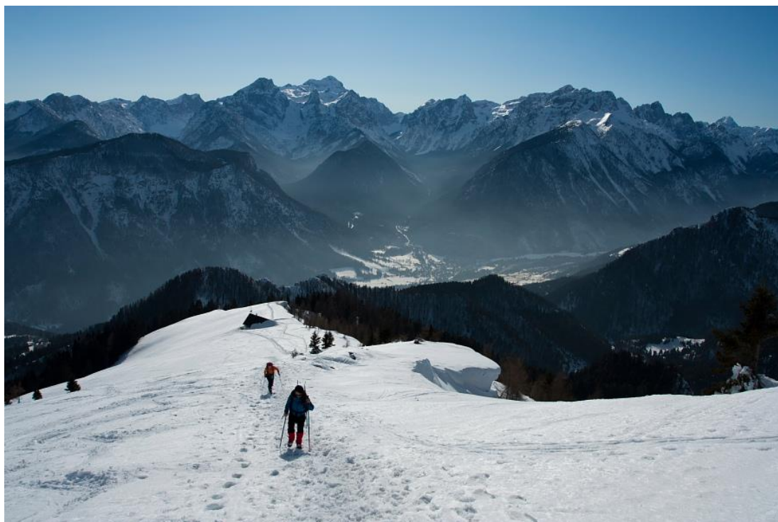
Salendo sulla Dovska Baba verso Il Tricorno